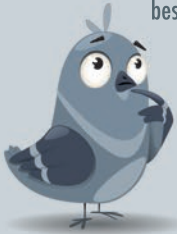
Taube mit gebrochenem Flügel

Außerdem suchen Tauben ständig nach Futter. Doch weil in Kiel ein Fütterungsverbot besteht, bekommen sie nicht genug Nahrung. Also picken sie einfach alles auf, was sie finden können. Das ist natürlich nicht immer gesund und viele Tauben bekommen Durchfall davon. Andere finden einfach nichts zu essen und sie verhungern irgendwann.